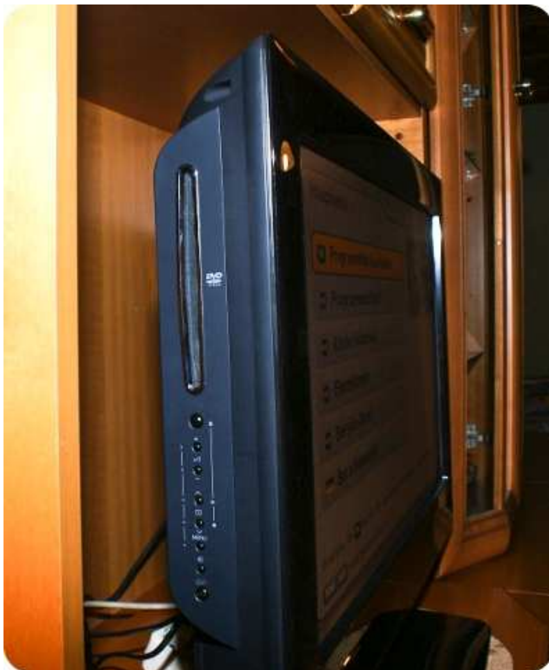
Im TV ist der DVD -Player gleich integriert.

Zudem kann man keine Namen den Listen zuordnen, sodass sich Familienmitglieder anhand von Nummern merken müssen, welche Liste „ihre“ Favoriten enthält. Im Alltag kommt man mit dem Toshiba gut zurecht. Mithilfe ansprechender Grafiken gibt das Menü auf einen Blick Orientierung, wo sich die jeweils gesuchten Funktionen finden lassen. Nicht ganz so glatt und besser vorstellen könnten wir uns, dass Zusammenspiel zwischen Menü und Fernbedienung.