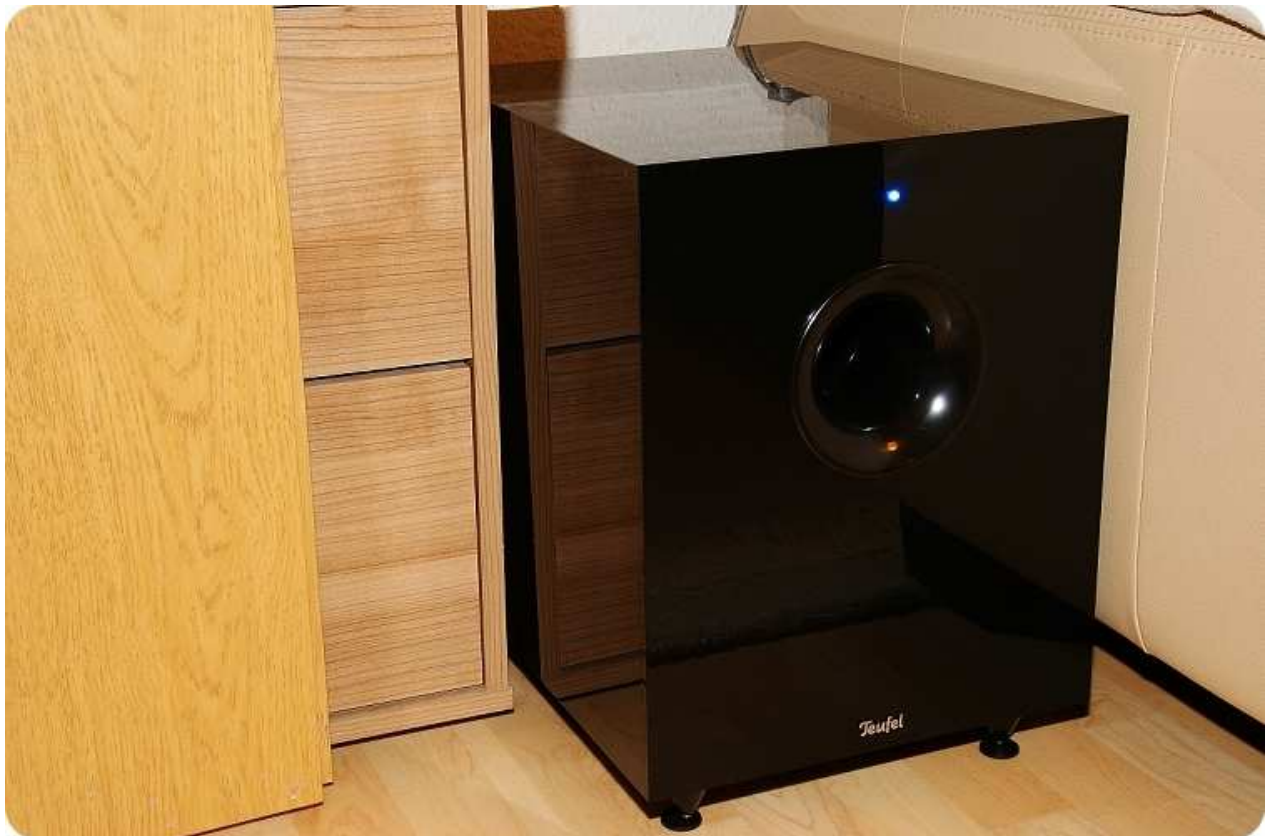
Der optisch ansprechende K 300 SW ist der ideale Spielpartner für jedes HiFi- Cinema- oder Stereo- System.

Der 250 mm langhubige Tieftonchassis mit besonders breiter Gummisicke in Downfire Auslegung, wurde sehr sauber im großzügig, dimensionierten MDF- Gehäuse eingelassen. Die neu optimierte 150 Watt Endstufe sorgt für eine sagenhafte Basswiedergabe. Um den nötigen Abstand zum Boden sicherzustellen, verfügt der Subwoofer über vier resonanzdämpfende massive Spikes. Diese gewährleisten nicht nur den sicheren Stand sondern auch die entsprechende Entkoppelung zum Boden.