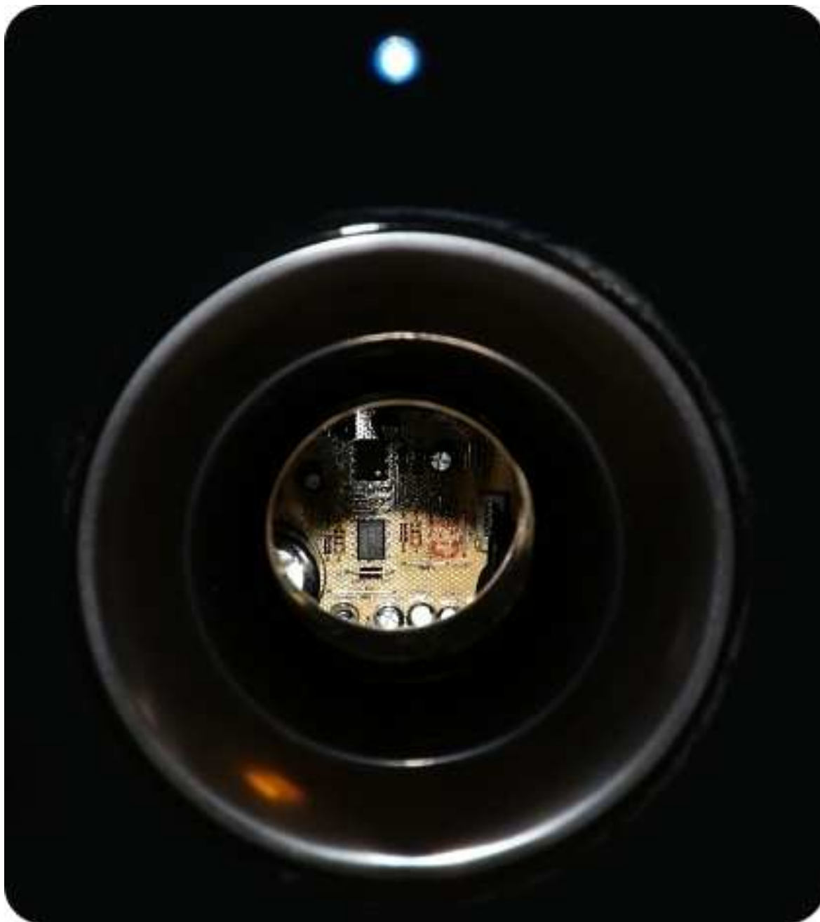
Die Platine des K 300 SW. Mit bloßem Auge kaum erkennbar, dank unserer Daisy wurde sie sichtbar.