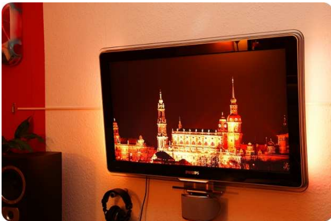
Der Philips 37 PFL 9603 bringt in jeden TV-Haushalt pure Bildfaszination

Das Unternehmen Philips markiert mit seiner neuen Flat-TV Serie 9600 einen weiteren entscheidenden "High Definition- Technologie" Meilenstein für Ihr Home Cinema Erlebnis. Er bietet zugleich anspruchsvolles und modernes Design, unglaubliche Schärfe, natürliche Bewegungen, leuchtende Farben und einzigartige Kontraste. Diese gehen Hand in Hand mit atemberaubendem Klang.