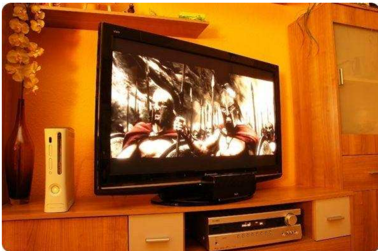
Auszug einer Angriffsszene aus dem Film "300"

Für die Begutachtung der Bildqualität setzten wir den, per Colorfacts- System richtig kalibrierten, Panasonic TX-P42S10E ein. Von Anfang an gefällt uns die kräftige und dennoch natürlich wirkende Farbabbildung.