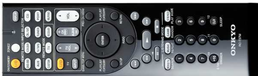
Die Vorprogrammierte RI (Remote Interactive) Fernbedienung

Die gut gestaltete, leider nicht beleuchtete, RI- Fernbedienung liegt angenehm in der Hand. Sie bietet zahlreiche Funktionen und kann auch für andere Geräte eingesetzt werden. Etwas klein geraten ist die wohl "wichtigste" Taste - die Lautstärketaste! Um die richtige Auswahl zu treffen, muss schon genau hingesehen werden. Schwierig beim Betrieb in abgedunkelten Räumen!