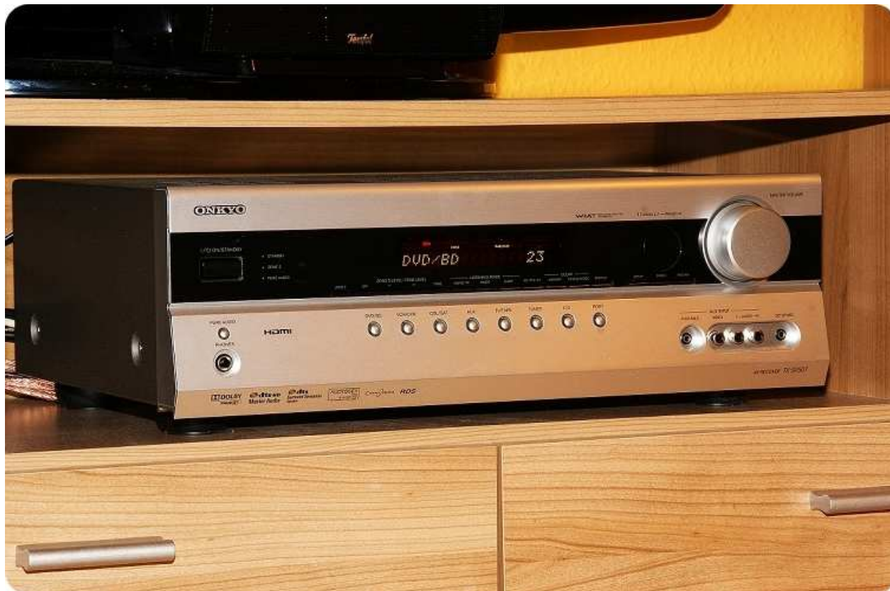
Onkyo TX-SR 507

Der AV- Bolide aus dem Hause Onkyo machte uns Tester schon beim ersten Anblick nervös. Für rund 400 Euro bietet er alles, was das Einsteigerherz begehrt, plus soliden Klang. Der lizenzpflichtige, kostspielige und vollgestopfte AV-Receiver könnte ein Schnäppchen des Jahrhunderts werden.