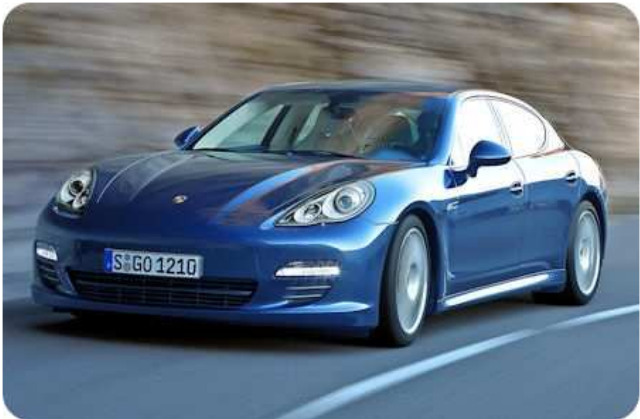
Porsche Panamera Turbo

Schiere Lautstärke war jedoch nicht das Hauptziel bei der Entwicklung der Anlage. Wie der Panamera in Sachen Fahrdynamik für eine Limousine neue Maßstäbe setzen soll, will das Soundsystem schlicht Klangreferenz werden. Aus diesem Grund greift Burmester auf Lautsprecher aus seinen sündhaft teuren Heim-Boxen zurück, wie den speziellen Air-Motion-Hochtöner im Armaturenbrett. Als schwingendes Element fungiert hier statt der üblichen Kalotte eine gefaltete Folie, die durch ihre geringe Masse (0,4 Gramm) besonders impulsfreudig und damit lebendig spielen soll. Um den Mittel- und Tieftonbereich kümmern sich in den Türen zudem Lautsprecher mit leichten Glasfaser-Membranen sowie verwindungssteifen Körben aus Alu-Druckguss.