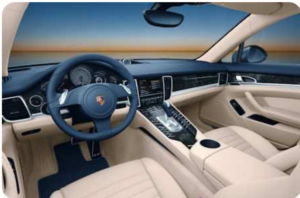
Innenraum Porsche Panamera

Panamera- Fahrer, die sich neben der Burmester - Anlage auch für das Infotainment-System PCM entscheiden, kommen ohnehin in den Genuss von echtem 5.1-Surround-Sound von entsprechenden DVD. Die erste Hörprobe macht also Lust auf ausgedehnte Soundchecks im Fahrbetrieb, wo ein Mikrophon permanent die Innengeräusche überwacht und das Klangbild daran anpasst. Mit knapp 4.800 Euro gehört die Anlage jedoch nicht nur zu den besten, sondern auch teuersten Soundsystemen fürs Auto. Für musikbegeisterte Porsche- Fahrer dennoch fast schon eine Okkasion. Burmester - Heimanlagen liegen mit Preisen bis über 100.000 Euro schließlich auf dem Niveau eines kompletten Panamera.