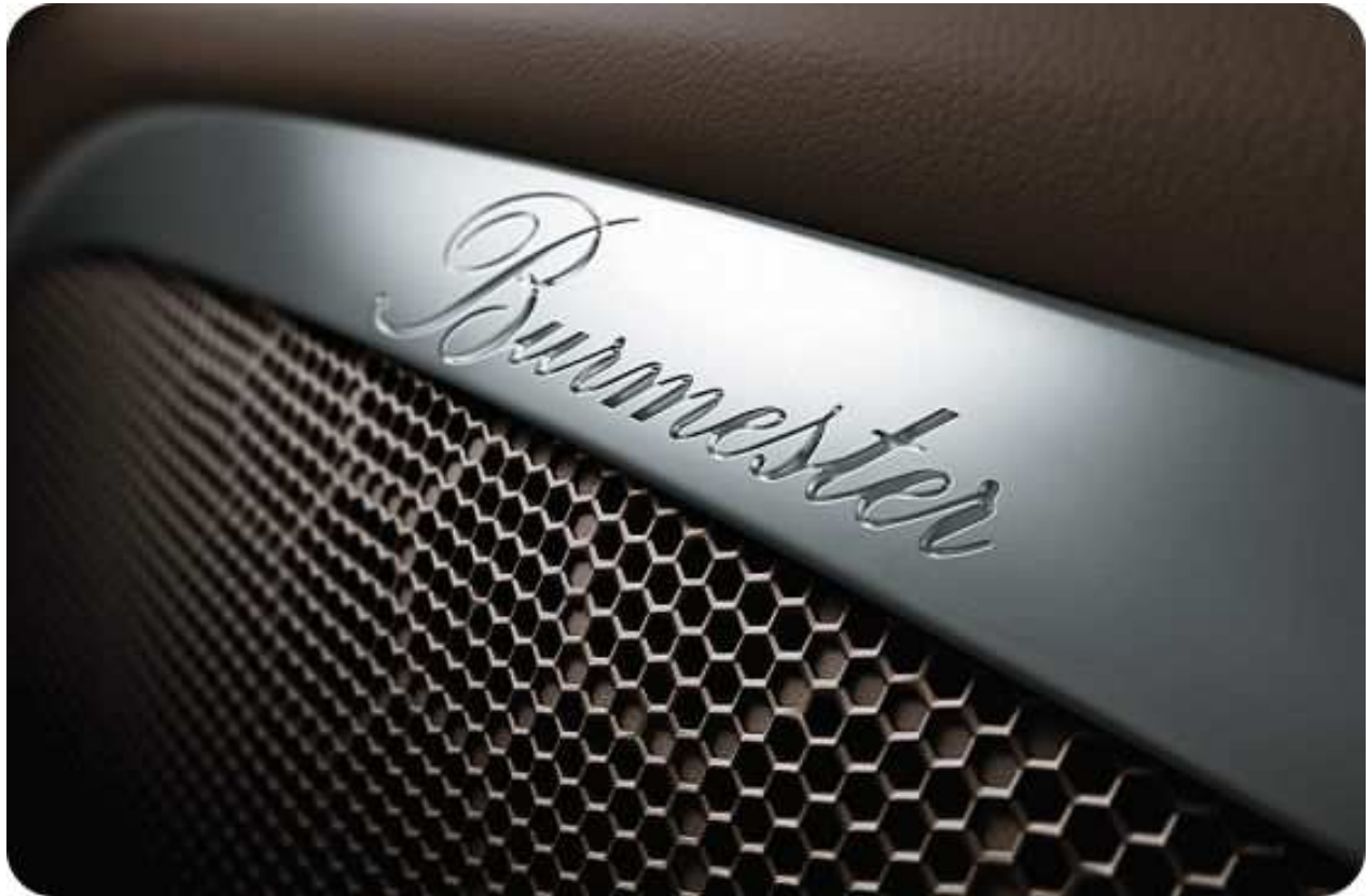
Burmester Schriftzug auf galvanisierten Lautsprecherblenden

Der Sound aus Weissach bekommt Verstärkung aus Berlin. Die Rede ist von Burmester, der Berliner Edelmanufaktur, einem der renommiertesten High-End-Anbieter im audiophilen Bereich weltweit.